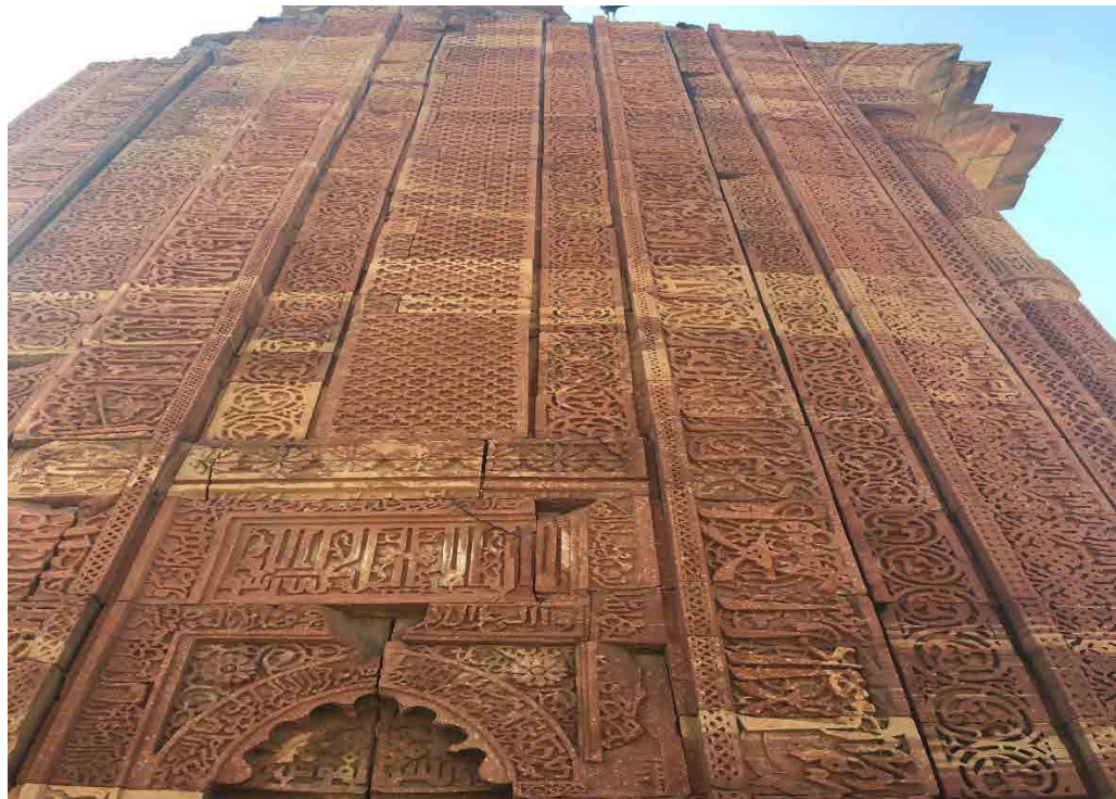
تصویر ۲: منار قطب-دهلی نو.